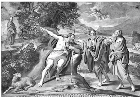
Domenico Zampieri (dit Le Dominiquin, 1581-1641) L'agneau de Dieu

2 ème Dimanche du temps ordinaire 14 janvier 2024