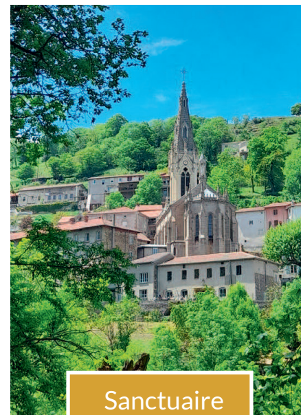
Sanctuaire de Valfleury