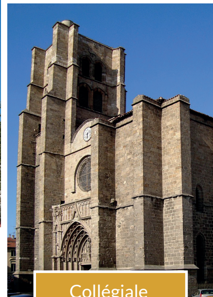
Collégiale de Montbrison